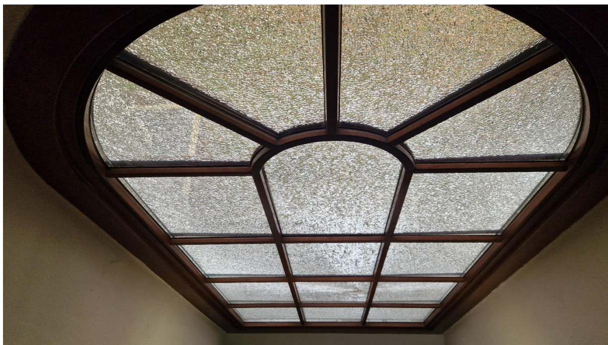
Fot. Kościół w Obszy, uszkodzone okno – widok od wewnątrz, stan zachowania na 2024 r.