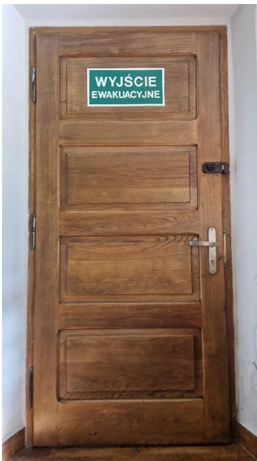
Fot. Kościół w Obszy, drzwi zewnętrzne do wymiany, stan zachowania na 2024 r.