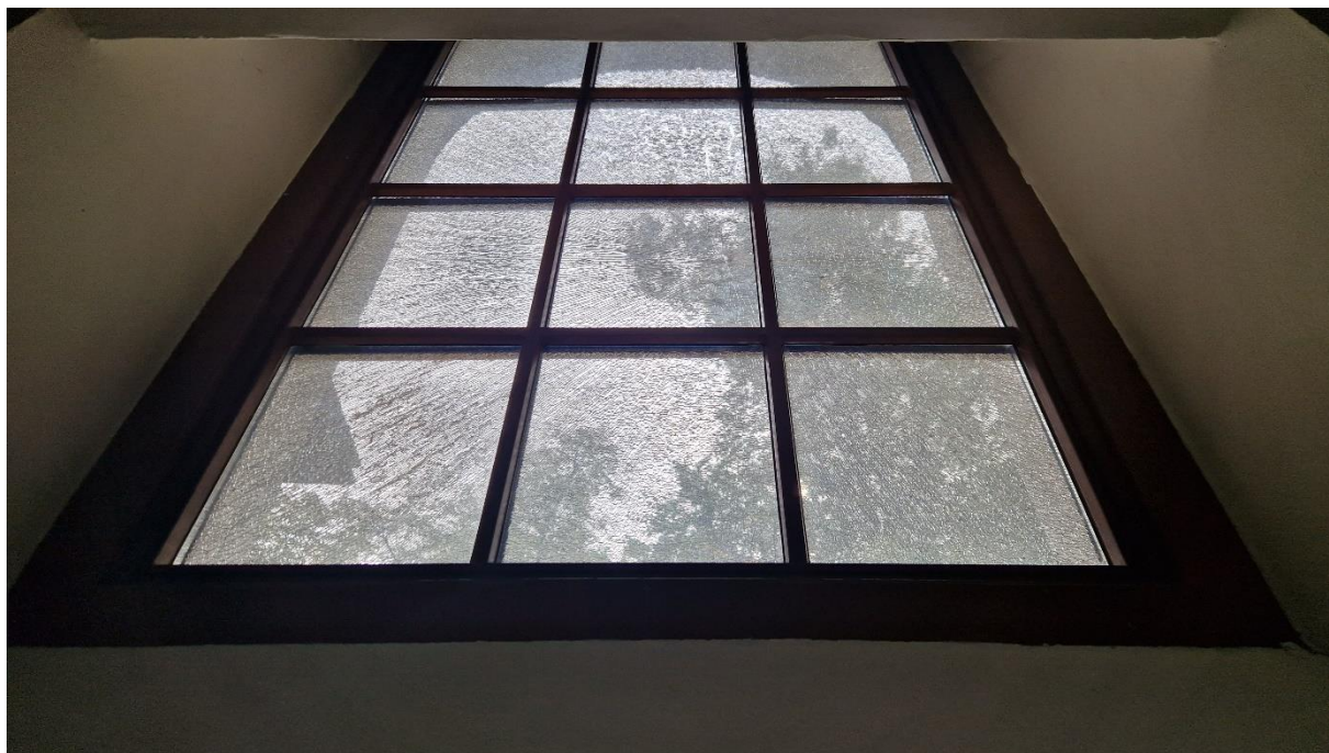
Fot. Kościół w Obszy, uszkodzone okno – widok od wewnątrz, stan zachowania na 2024 r.