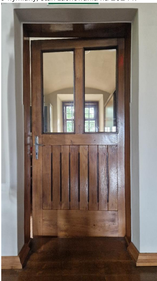
Fot. Kościół w Obszy, drzwi do zakrystii do wymiany, stan zachowania na 2024 r.