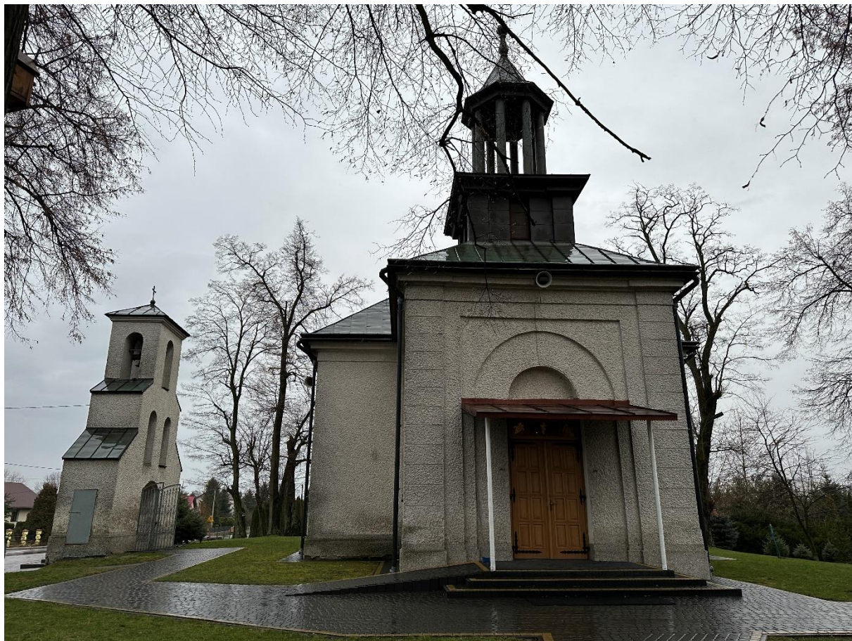
Fot. Kościół w Obszy, elewacja zachodnia – z istniejącym zadaszeniem, stan zachowania na 2024 r.