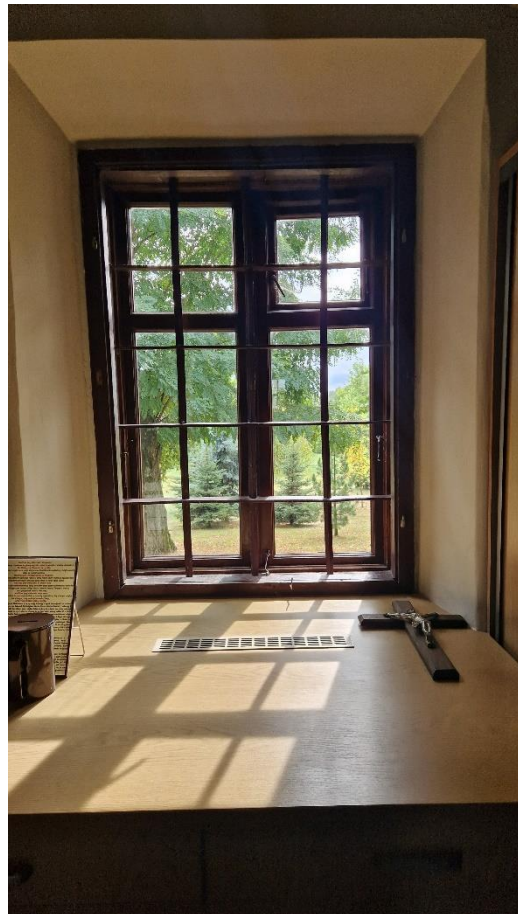
Fot. Kościół w Obszy, okno skrzynkowe do wymiany, stan zachowania na 2024 r.