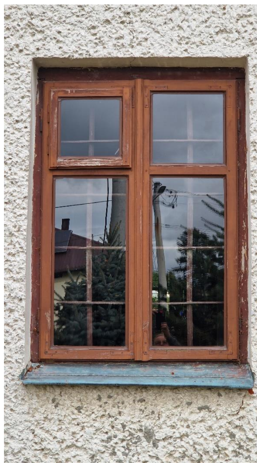
Fot. Kościół w Obszy, okno skrzynkowe do wymiany, stan zachowania na 2024 r.