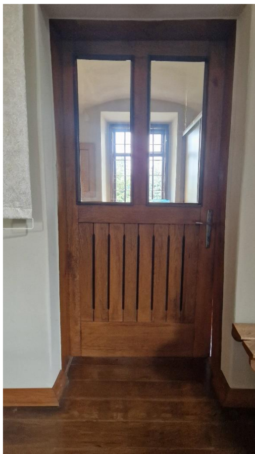
Fot. Kościół w Obszy, drzwi do zakrystii do wymiany, stan zachowania na 2024 r.