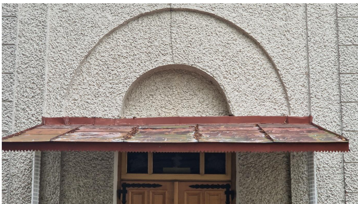
Fot. Kościół w Obszy, elewacja zachodnia – istniejące zadaszenie przeznaczone do demontażu, stan zachowania na 2024 r