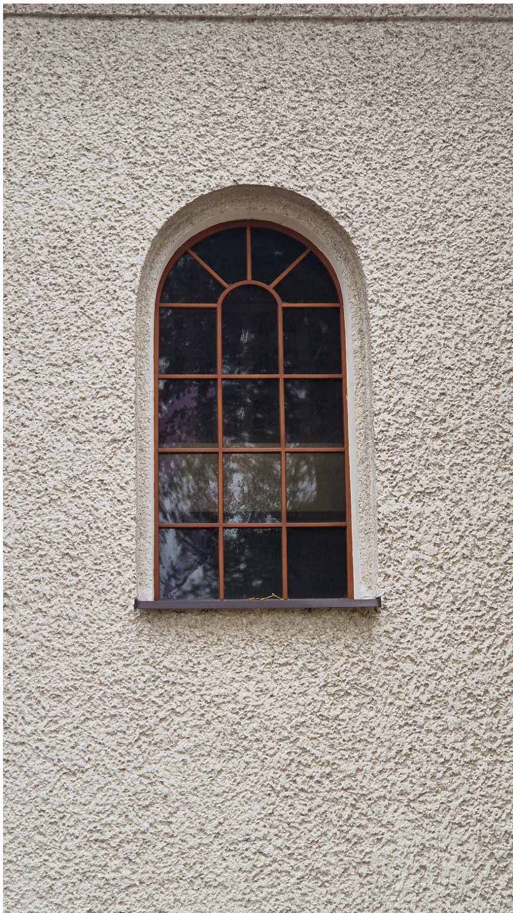
Fot. Kościół w Obszy, uszkodzone okno, stan zachowania na 2024 r.